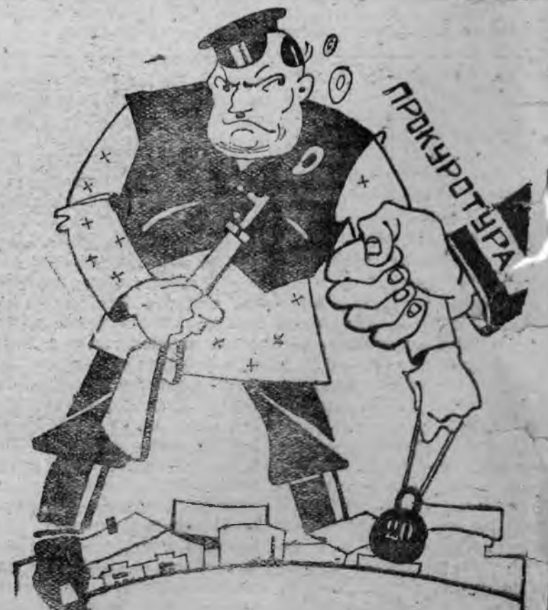
Дадим жестокий отпор кулаку — врагу хлебозаготовок

Колхоз должен лучше других понимать всю важность обеспечения государству возможно большего количества хлеба. Чем больше хлеба, тем легче выполнение пятилетки в четыре года, тем шире работа промышленности, дающей сельскому хозяйству и тракторы и машины, и промышленные товары. Государство оказало колхозному движению большую поддержку, дало колхозам целый ряд льгот, ассигновало специальные